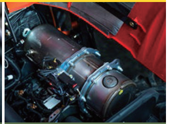
FILTRO DE PARTÍCULAS - FASE V