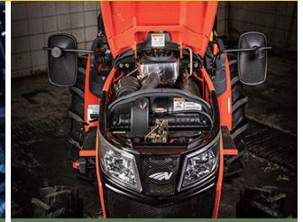
ARRANJO COMPACTO - ÁREA DO MOTOR