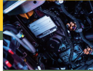
PRESTIGIADO MOTOR YANMAR